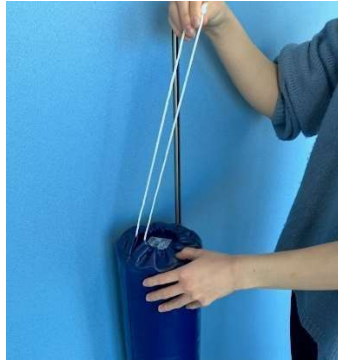
ヒモの結び目をほどき、すべて伸ばします。