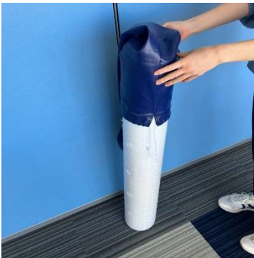
上下を反転させると楽に外せます。