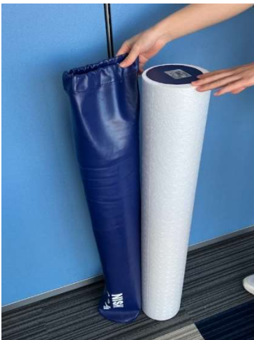
カバーが外れました。 芯材に変形などがないか確認してください。