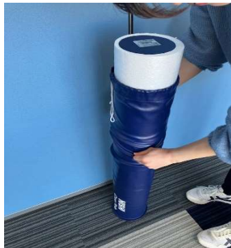
徐々に芯材が出てきます。