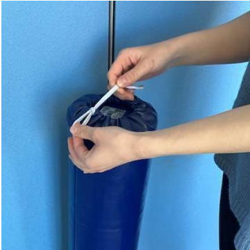
カバーのヒモが通っている穴からヒモを引きだします。