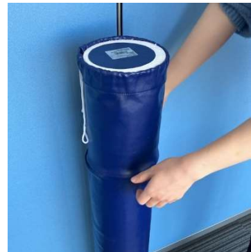
カバーの側面を引っ張りながらずらします。