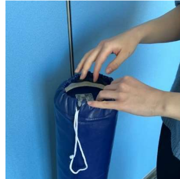
カバーの口を開きます。