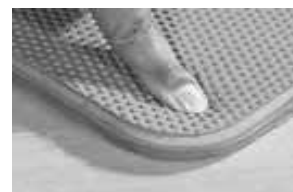
表面は、エンボス仕上げ